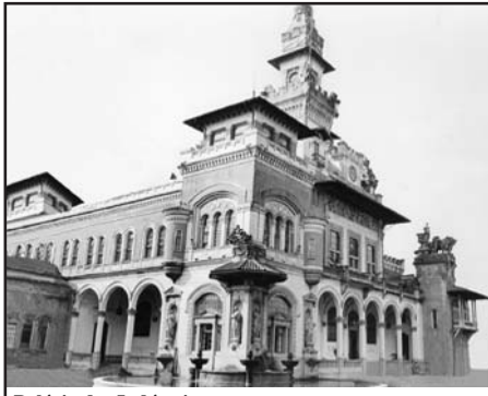
Palácio das Indústrias Parque D. Pedro II - Cep:03003-000 - Pabx:3315-9077