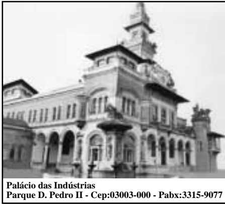
Palácio das Indústrias Parque D. Pedro II - Cep:03003-000 - Pabx:3315-9077