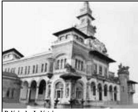
Palácio das Indústrias Parque D. Pedro II - Cep:03003-000 - Pabx:3315-9077