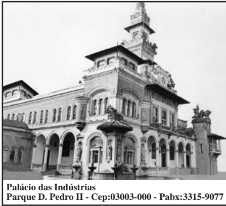
Palácio das Indústrias Parque D. Pedro II - Cep:03003-000 - Pabx:3315-9077