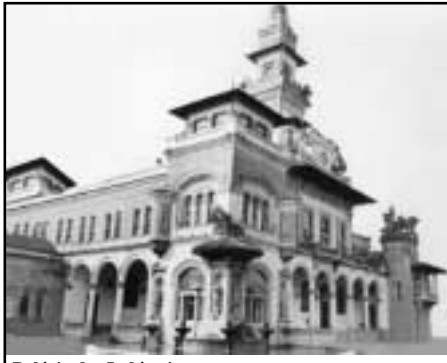
Palácio das Indústrias Parque D. Pedro II - Cep:03003-000 - Pabx:3315-9077