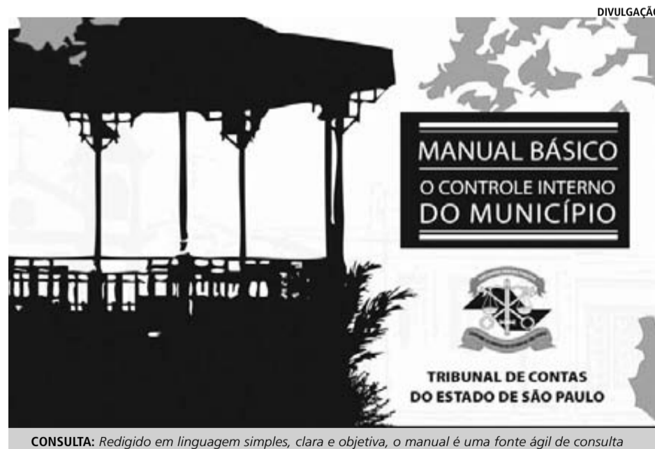
CONSULTA: Redigido em linguagem simples, clara e objetiva, o manual é uma fonte ágil de consulta

“A publicação reflete justamente a missão