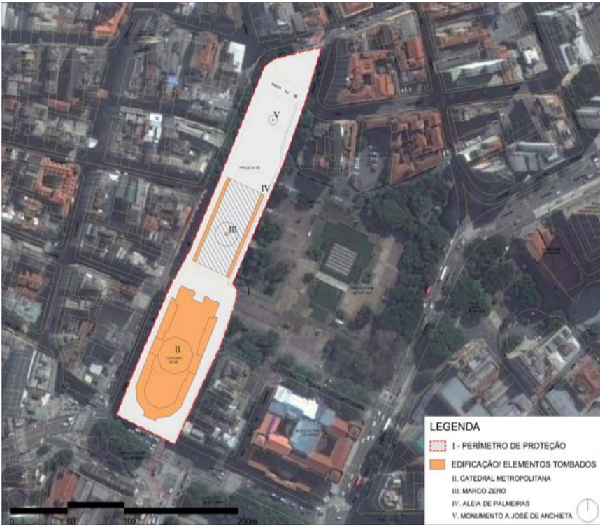
Anexo II – Mapa do Perímetro de Tombamento