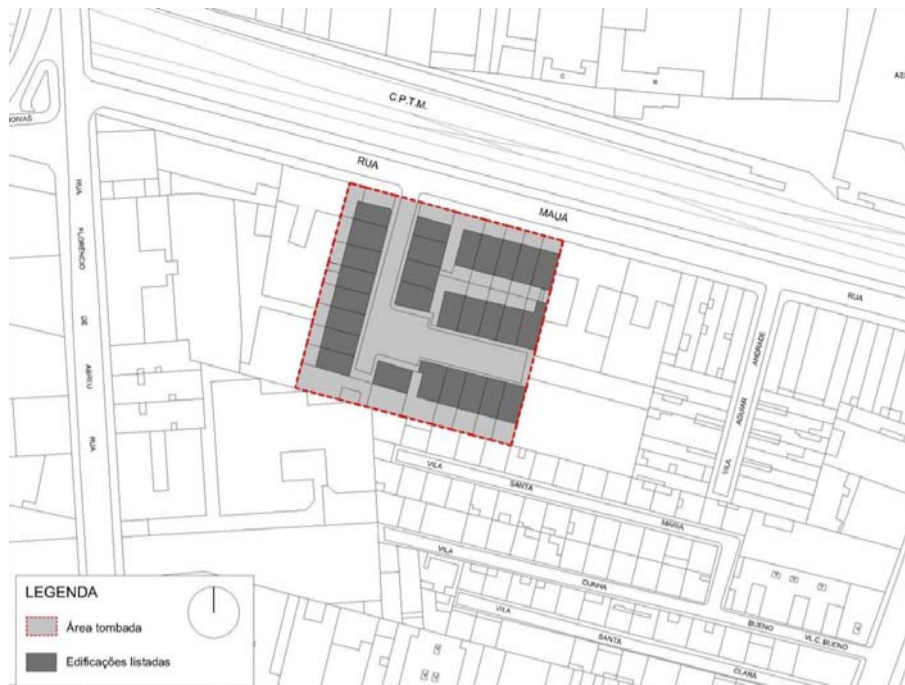
Anexo II - Mapa do Perímetro de Tombamento