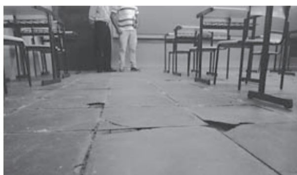
Imagem de escola degradada

DA ASSESSORIA DO DEPUTADO DONISETTE BRAGA