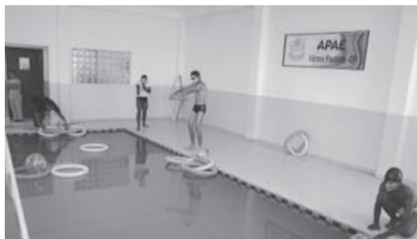
Piscina da Apae de Várzea Paulista