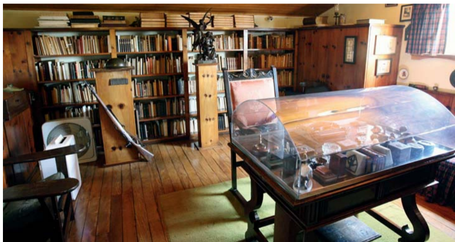
A mansarda, o último piso da residência, era o local preferido do escritor