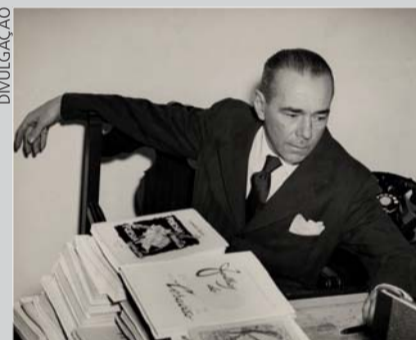
Guilherme: herói da Revolução de 1932

Nascido em Campinas, Guilherme de Almeida (1890-1969) assinou peças teatrais junto a Oswald de Andrade em 1916 e, no ano seguinte, estreou seu primeiro livro de poemas, Nós . Em 1922, com Mário de Andrade e Menotti del Picchia, colaborou para organizar a Semana de Arte Moderna, tendo fundado a revista Klaxon , porta-voz do movimento. Em 1928, foi eleito para a Academia Paulista de Letras e, dois anos depois, para a Academia Brasileira de Letras.