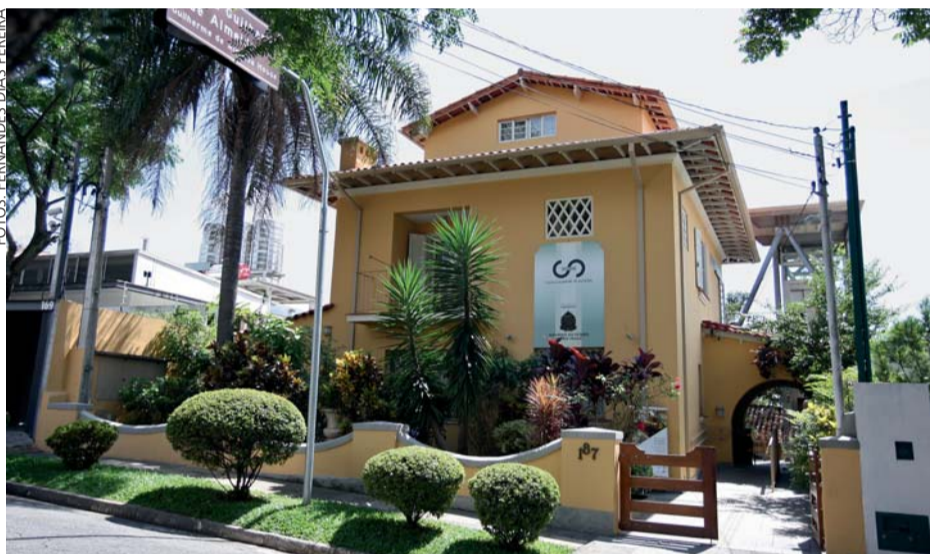
Museu preserva o acervo e pertences de um dos expoentes do modernismo brasileiro

Conhecer a antiga morada e o acervo do escritor e tradutor paulista é opção gratuita para comemorar o 464º aniversário de São Paulo; visita é das 10 às 18 horas