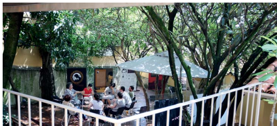
Além de visitas, Casa promove oficinas literárias, palestras e cursos

Em 1959, foi eleito o Príncipe dos Poetas Brasileiros em concurso do jornal Correio da Manhã . Guilherme morreu em 1969 e foi enterrado no Obelisco do Ibirapuera, mausoléu erguido em homenagem aos combatentes paulistas de 1932.