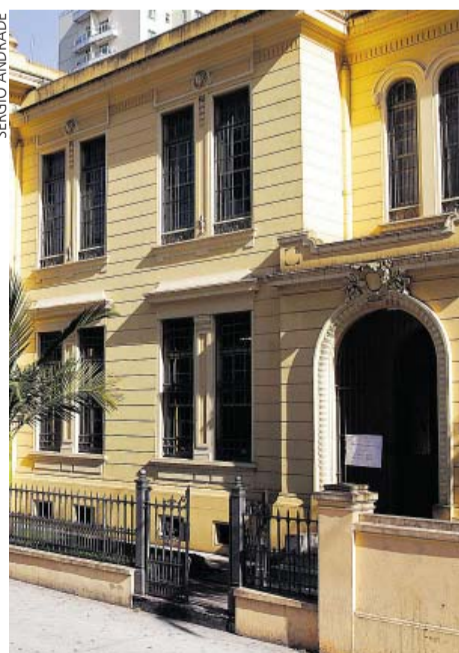
EE Rodrigues Alves – Respeito às diferenças

O evento tem a finalidade de divulgar as iniciativas mais importantes em âmbito internacional para o fortalecimento da reabilitação e das tecnologias nos sistemas de saúde, com foco nas diversas condições de saúde, que podem ser beneficiadas pela reabilitação, e na pesquisa, desenvolvimento e mercado de tecnologias assistivas na América Latina. Os interessados podem se inscrever no site goo.gl/7Jk6A9 . O encontro, gratuito, é dirigido a profissionais de saúde que atuam na área de reabilitação e a pesquisadores e representantes do governo e da indústria que tenham interesse no campo das tecnologias assistivas.